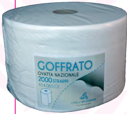
CARTA A ROTOLI