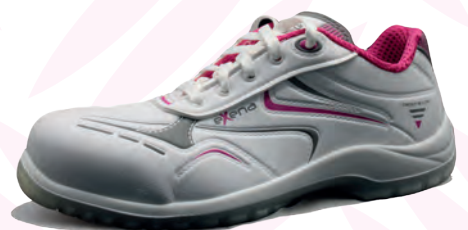
ALIMENTARI e SANITARIE