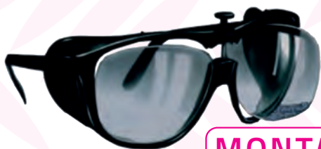
MONTATURA CON LENTI