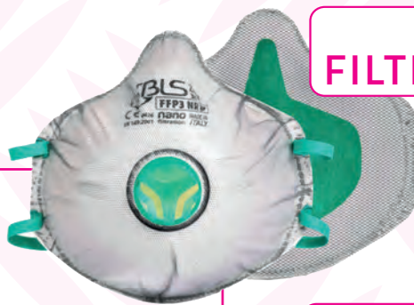
FACCIALE FILTRANTE A COPPA