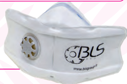
FACCIALE FILTRANTE PIEGHEVOLE