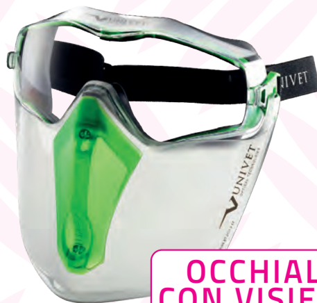
OCCHIALI CON VISIERA