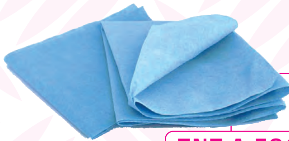
TNT A FOGLI