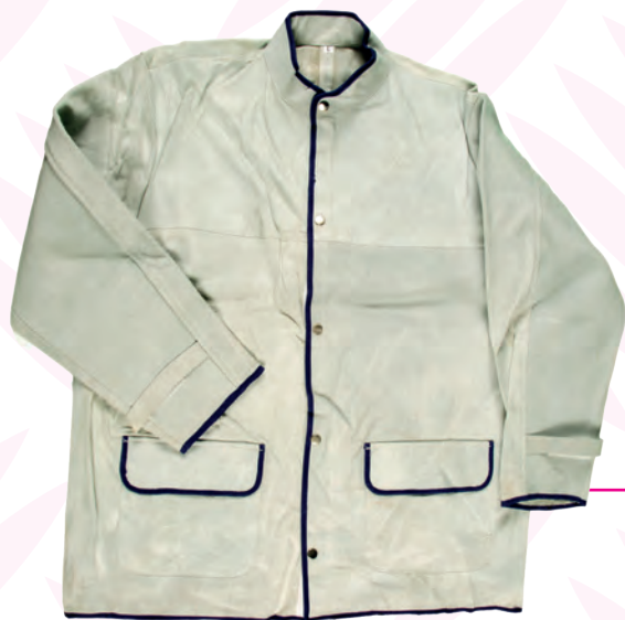
ABBIGLIAMENTO IN CROSTA