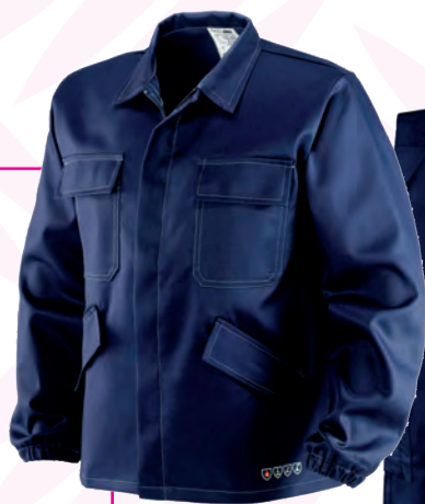
ABITI DA LAVORO