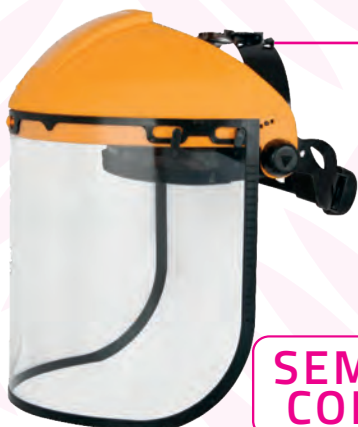
SEMICALOTTA CON VISIERA